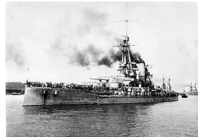
Linienschiff Bayern des III. Geschwaders, Bundesarchiv, Bild 183-R17811

Den nicht verhafteten Matrosen wurde Landurlaub gewährt. Diesen nutzten sie dazu, die Freilassung ihrer Kameraden zu fordern – der Kieler Matrosenaufstand begann.