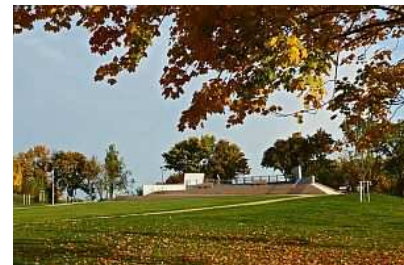
Landeshauptstadt Kiel / Ursula Soltau

Der Wiker Balkon befindet sich am nördlichen Ende des Schleusenparks, der sich zwischen Uferstraße und Herthastraße im Stadtteil Kiel-Wik direkt am Nord-Ostsee-Kanal erstreckt. Von hier aus haben Sie eine gute Aussicht auf die Holtenauer Schleusen.