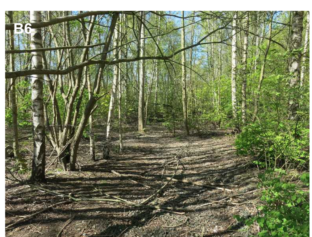
B6 Birkenwald mit alten Bahnschienen