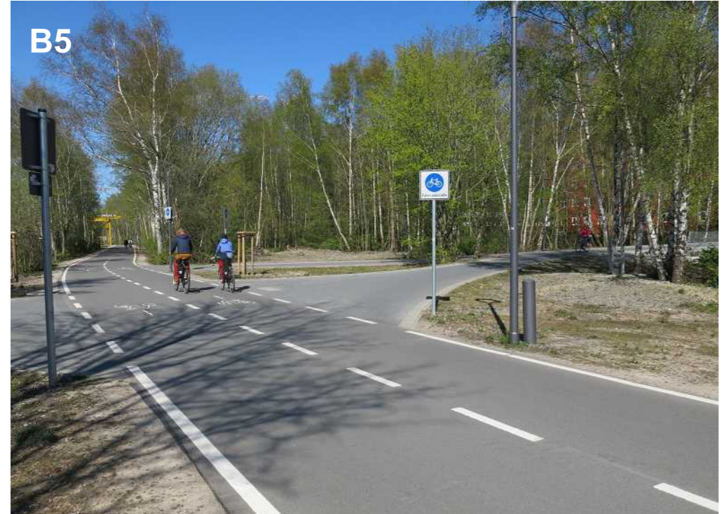
B5 Auftakt aus Südrichtung