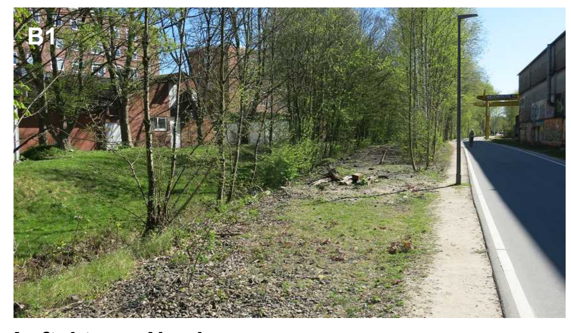
B1 Auftakt von Norden