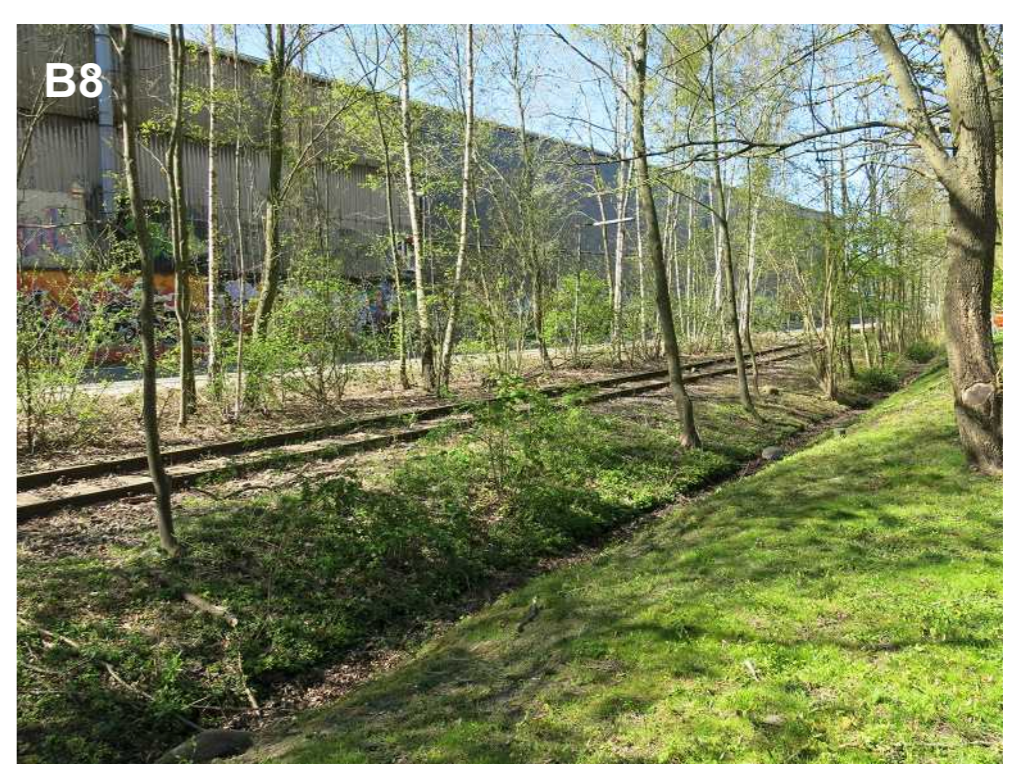
B8 Eindrücke vom nördlichen Bereich