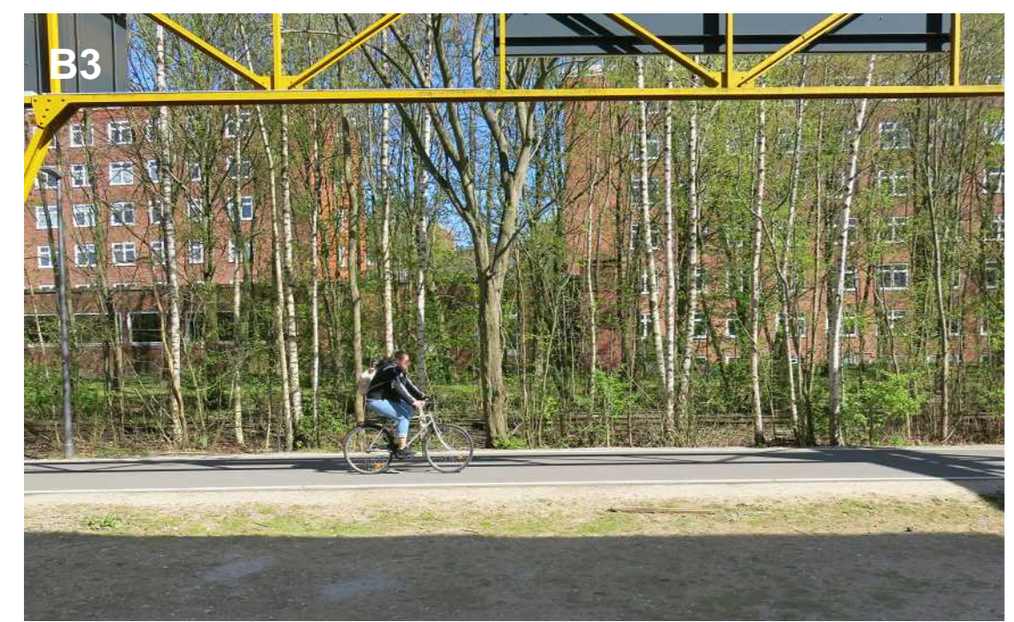
B3 Blickbeziehungen am alten Kran